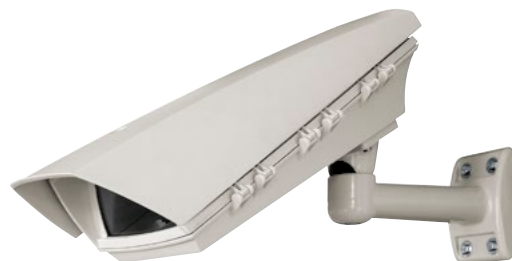
PUNTO HI-POE + WBOVA2